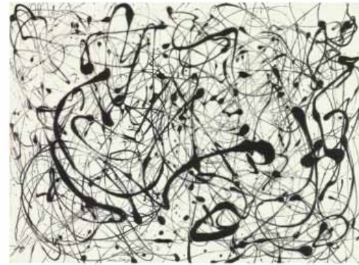
Jackson Pollock Number 14, 1951, Yale University Art Gallery